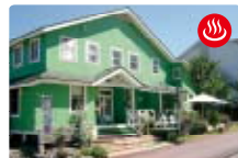
癒しの湯宿クレヨンハウス