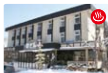
ペンションおこん など…