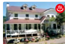
ペンション愛花夢