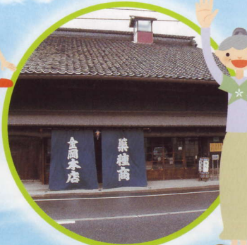
薬種商の館 金岡邸