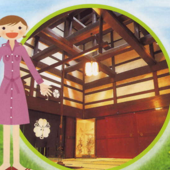
北前船回船問屋 森家