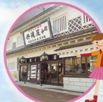
池田屋安兵衛商店