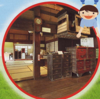
富山市民俗民芸村