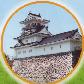
富山城 (富山市郷土博物館)