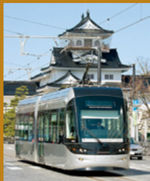
セントラムは シックな3色。