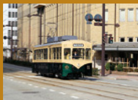
市内電車 (レトロ電車)