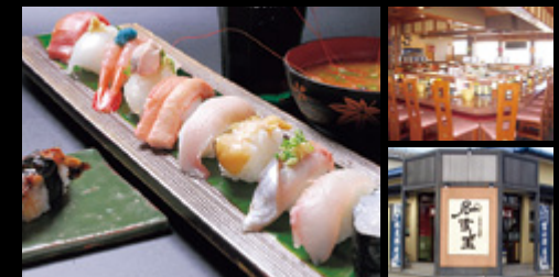
朝捕れ地物盛り(1,500円)

日本海の荒波で育まれた新鮮な魚貝を富山湾、氷見、 金沢港、能登より直送。水揚げされたばかりの活きのい いネタを、安心価格で提供している。季節ごとの旬の味 わいを楽しもう。