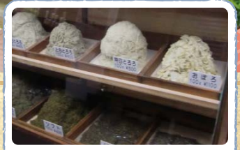
富山の昆布店の見学・試食

富山駅北口 13:20出発 ● ますのすしの源 13:50~15:00 ● 八島こんぶ店 15:15~15:40 ● 千石町通りを散策 ● 池田屋安兵衛商店 15:50~16:10 ● 富山駅北口 16:20頃着