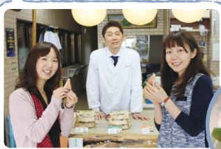
ます寿司を試食できます!