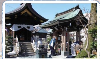
「万病に効く霊水」と謳われた名水や、名水から造られた地酒を試飲