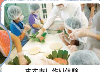
ます寿司作り体験