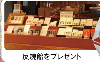
反魂飴をプレゼント