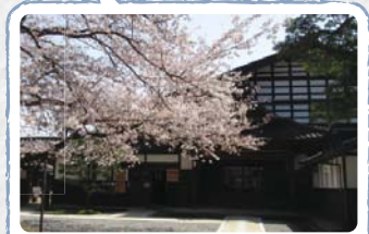
越中一千石といわれた豪農の館