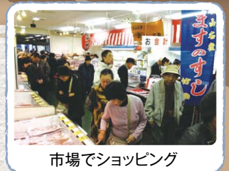
市場でショッピング

富山湾で水揚げされたネタを使用した、にぎり寿司の昼食 さらに、2F売店「まいどは屋」でのお買い物10%OFF!!