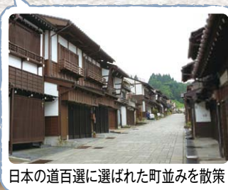
日本の道百選に選ばれた町並みを散策