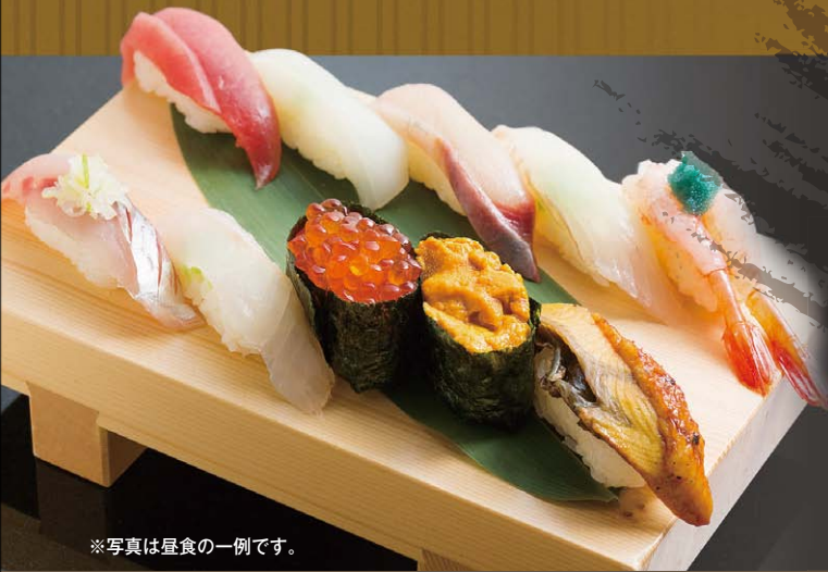
※写真は昼食の一例です。