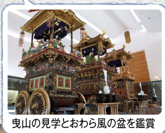
曳山の見学とおわら風の盆を鑑賞