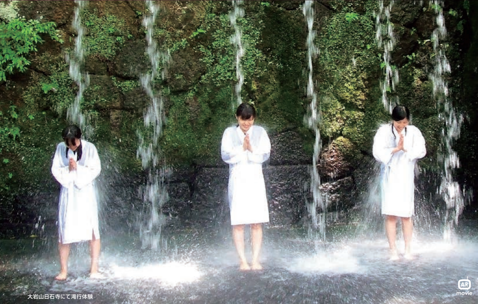
大岩山日石寺にて滝行体験