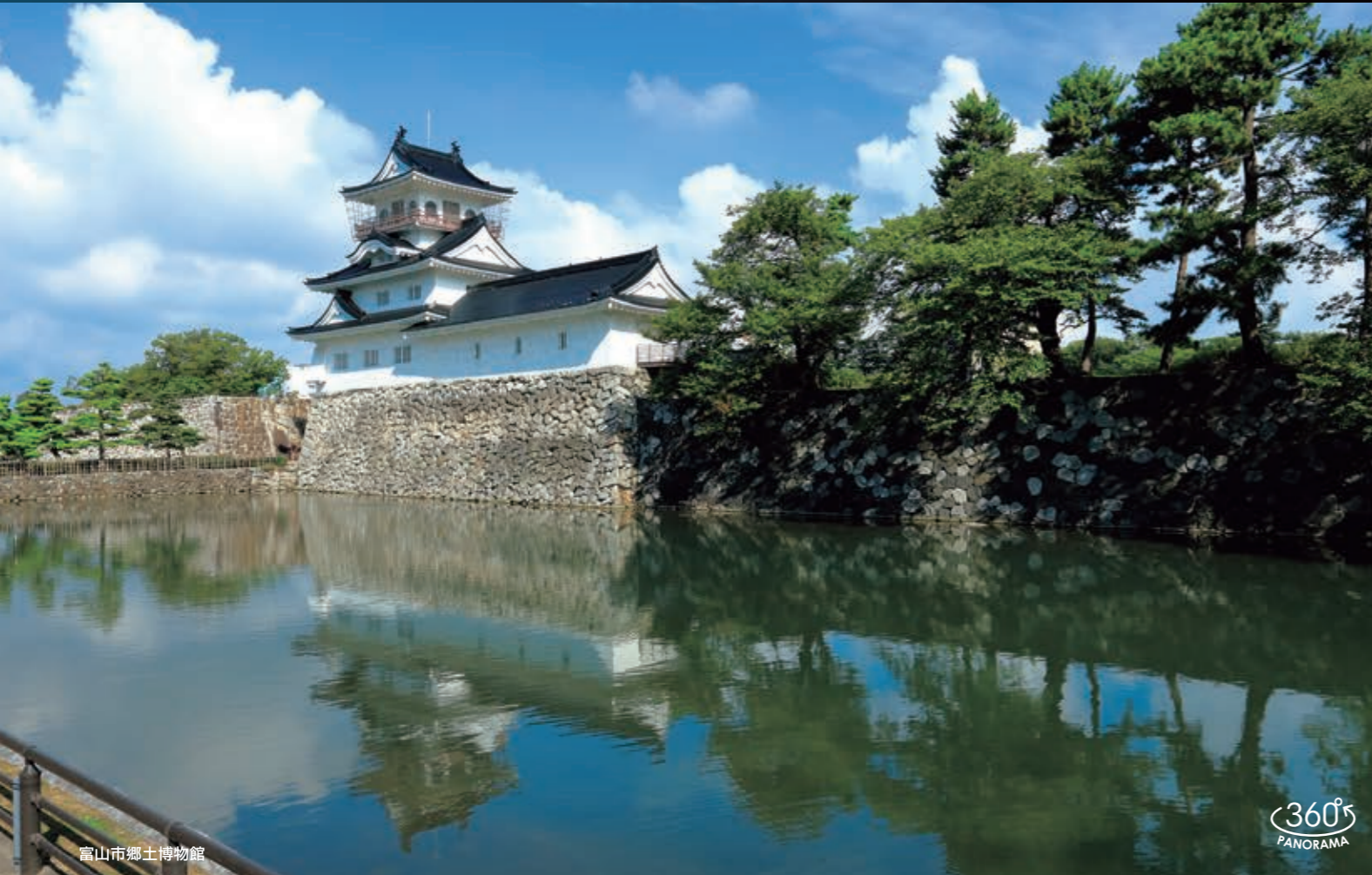
富山市郷土博物館