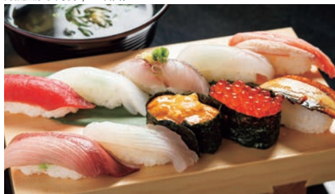
高級握壽司午餐 (1,780日圓)