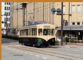
市內電車 (復古電車)