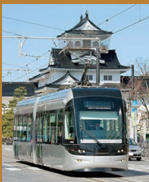
CENTRAM是別緻的三個顏色。