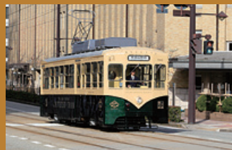
観光列車(レトロ電車)

「富山市の中心市街地」「富山駅」「港町・岩瀬」と、 市内を広く結ぶ路面電車。5～15分間隔で運行している ため、市内観光の足として誰でも気軽に利用できます。 車両のデザインは多彩で、モダンな低床車両や、温か みのある木を多用したレトロ車両など、見て楽しい、 乗って楽しいものばかりです。