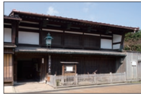
● 北前船回船問屋 森家/馬場家