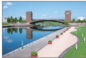
● 富岩運河環水公園