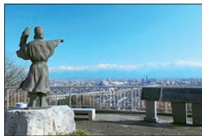
● 呉羽山公園展望台