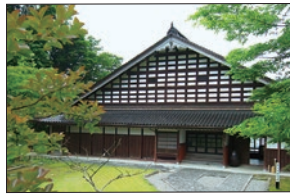
● 富山市民俗民芸村