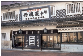
● 池田屋安兵衛商店