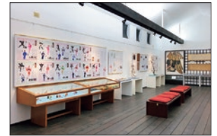
● 八尾おわら資料館